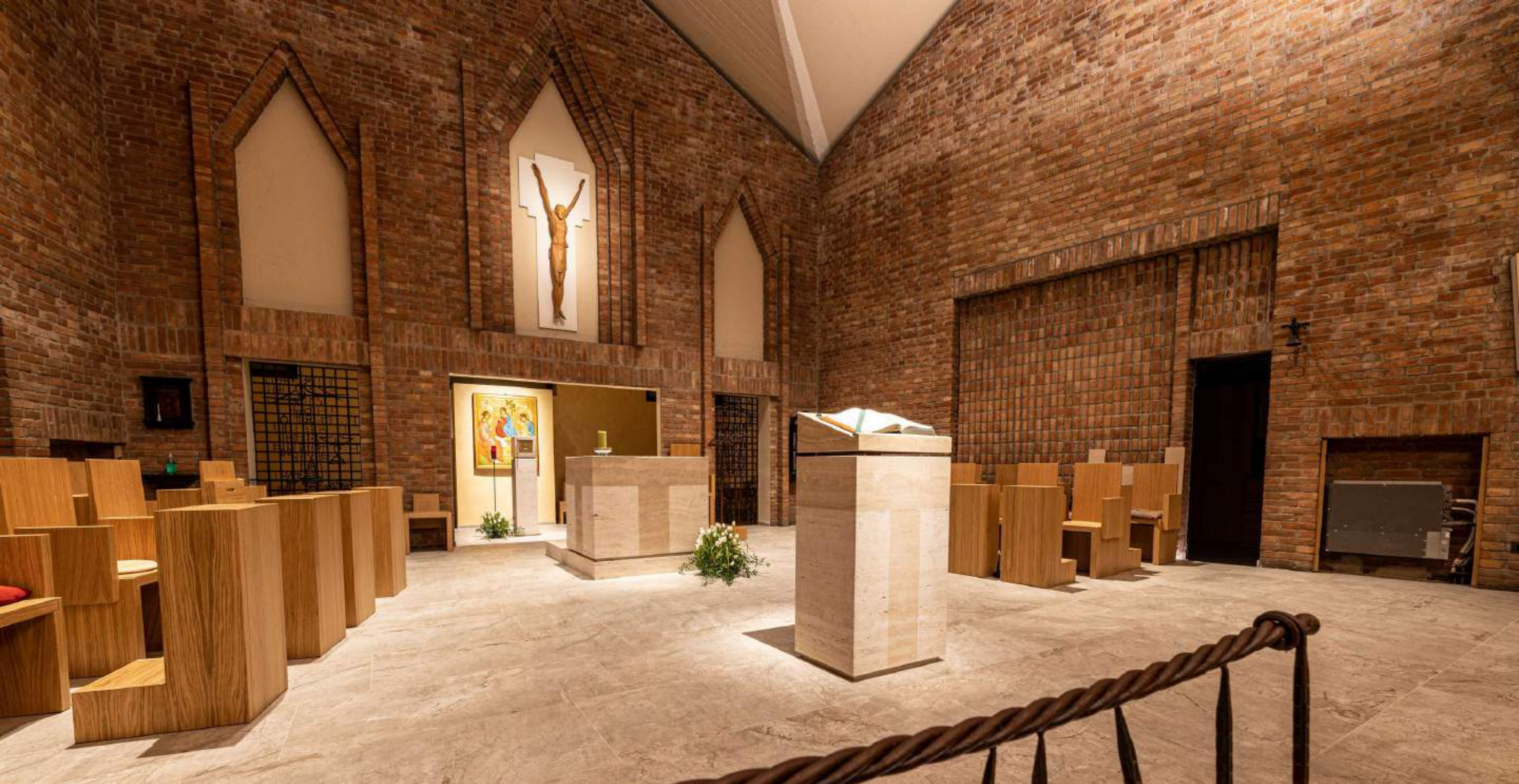
Monastero Suore Clarisse (BERGAMO)