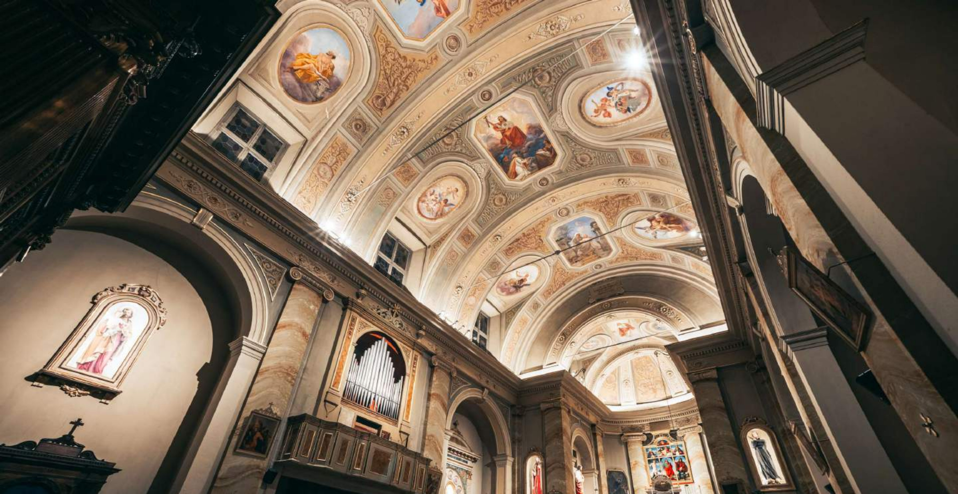
Chiesa parrocchiale di Peghera (BERGAMO)