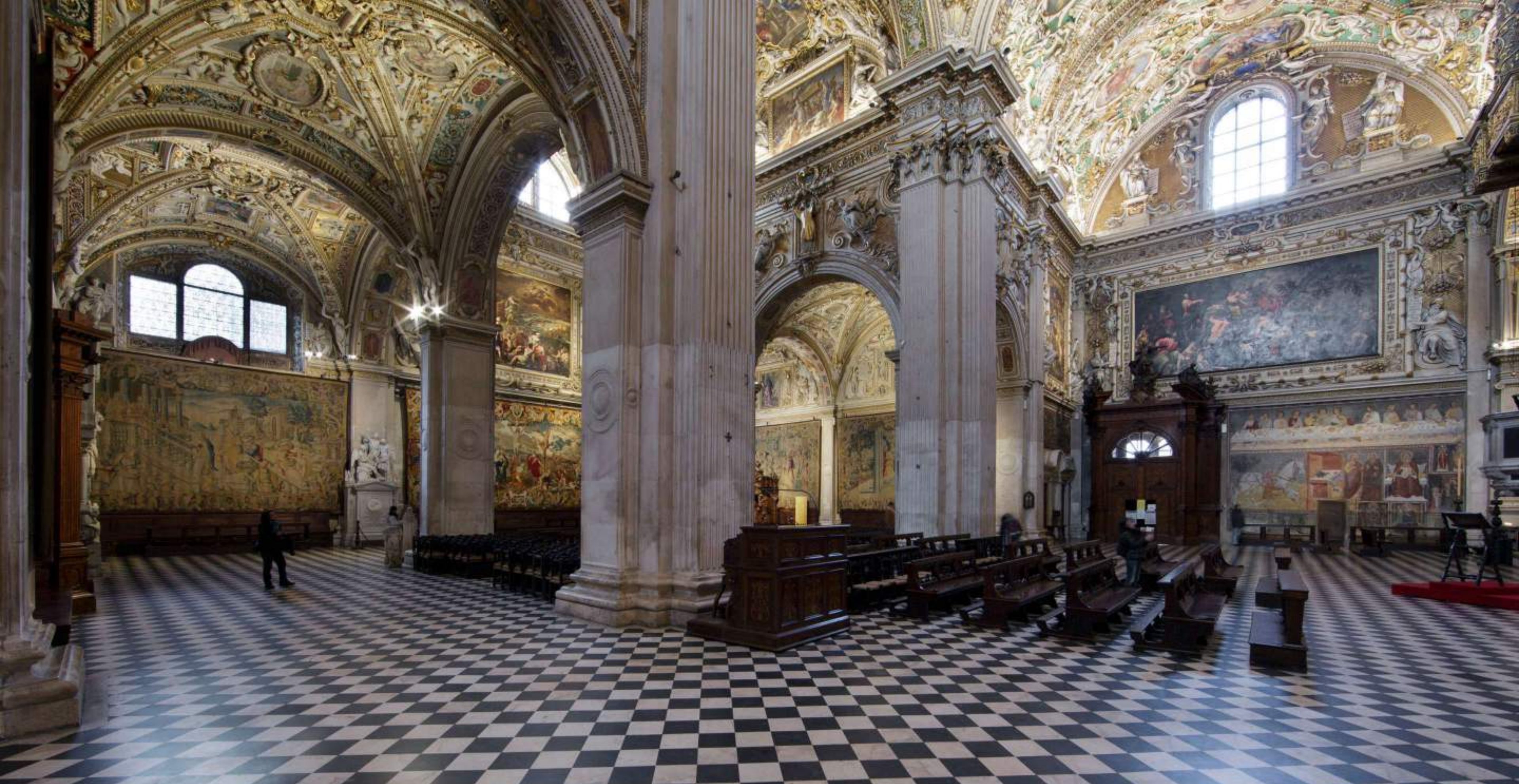
Basilica di Santa Maria Maggiore - Città Alta (BERGAMO)