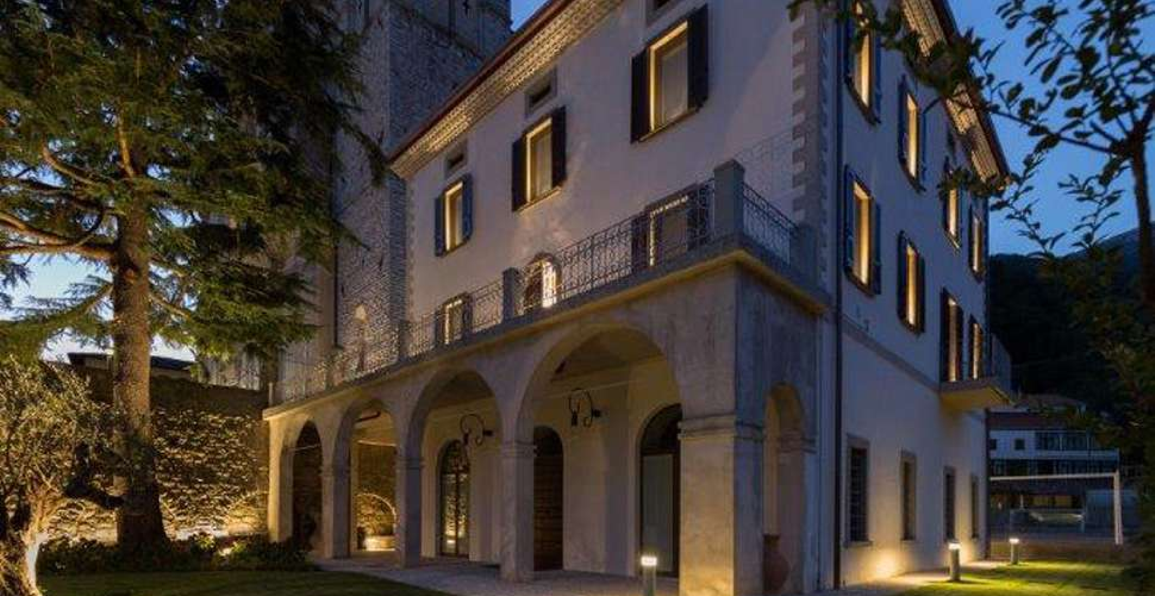
Canonica di Palazzago (BERGAMO)