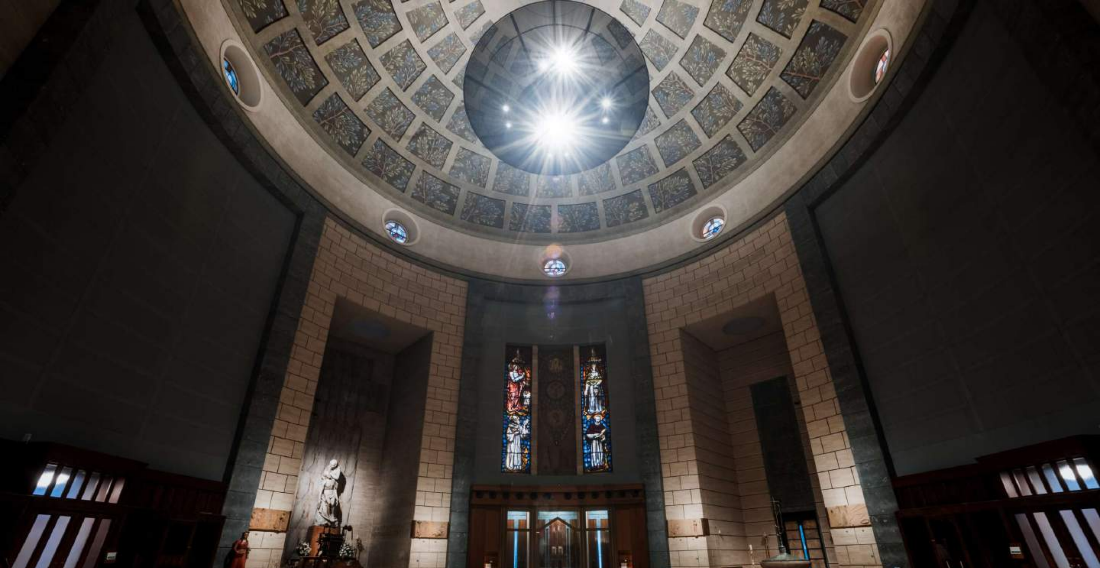
Tempio votivo (BERGAMO)