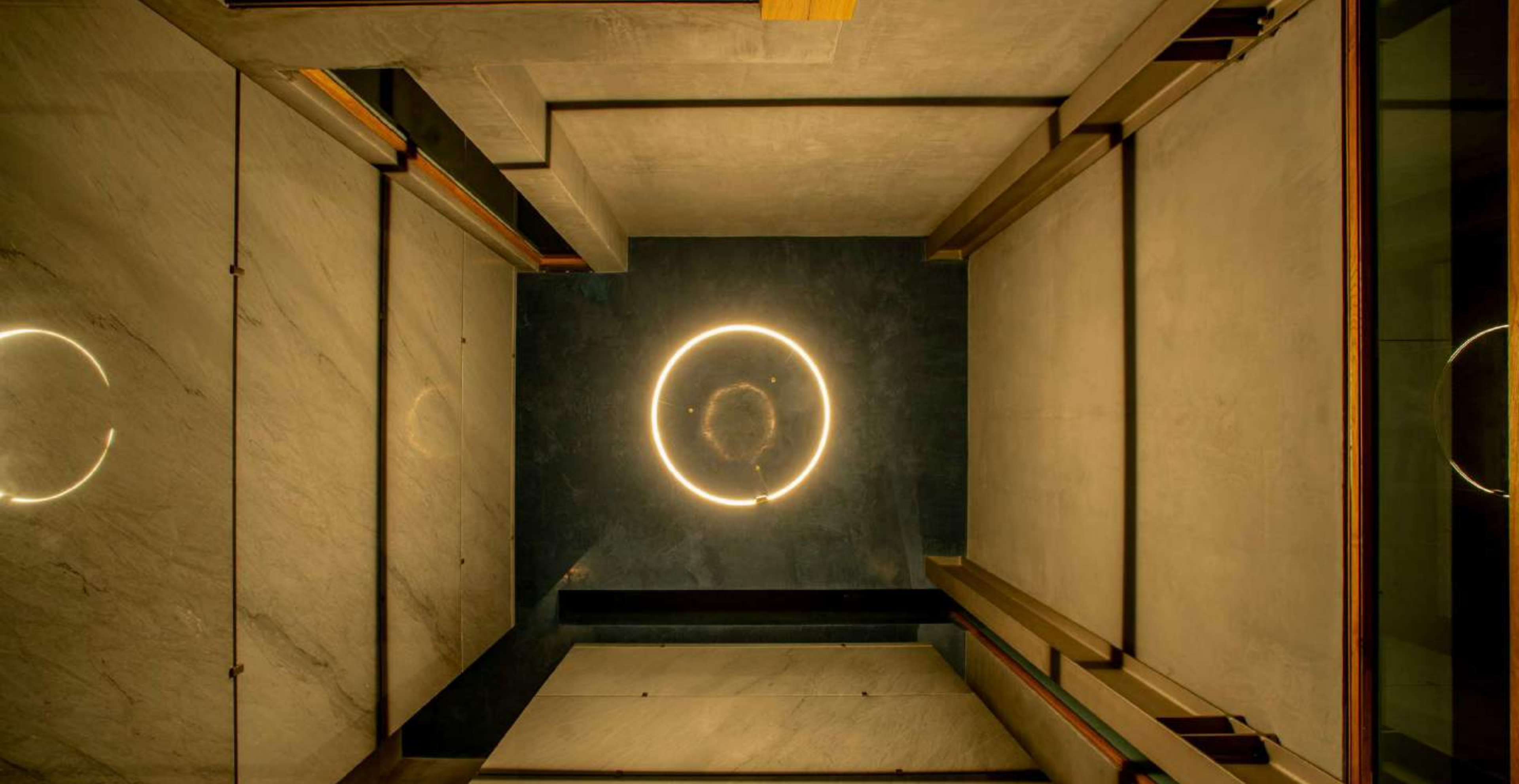
Cappella di famiglia (TREVISO)