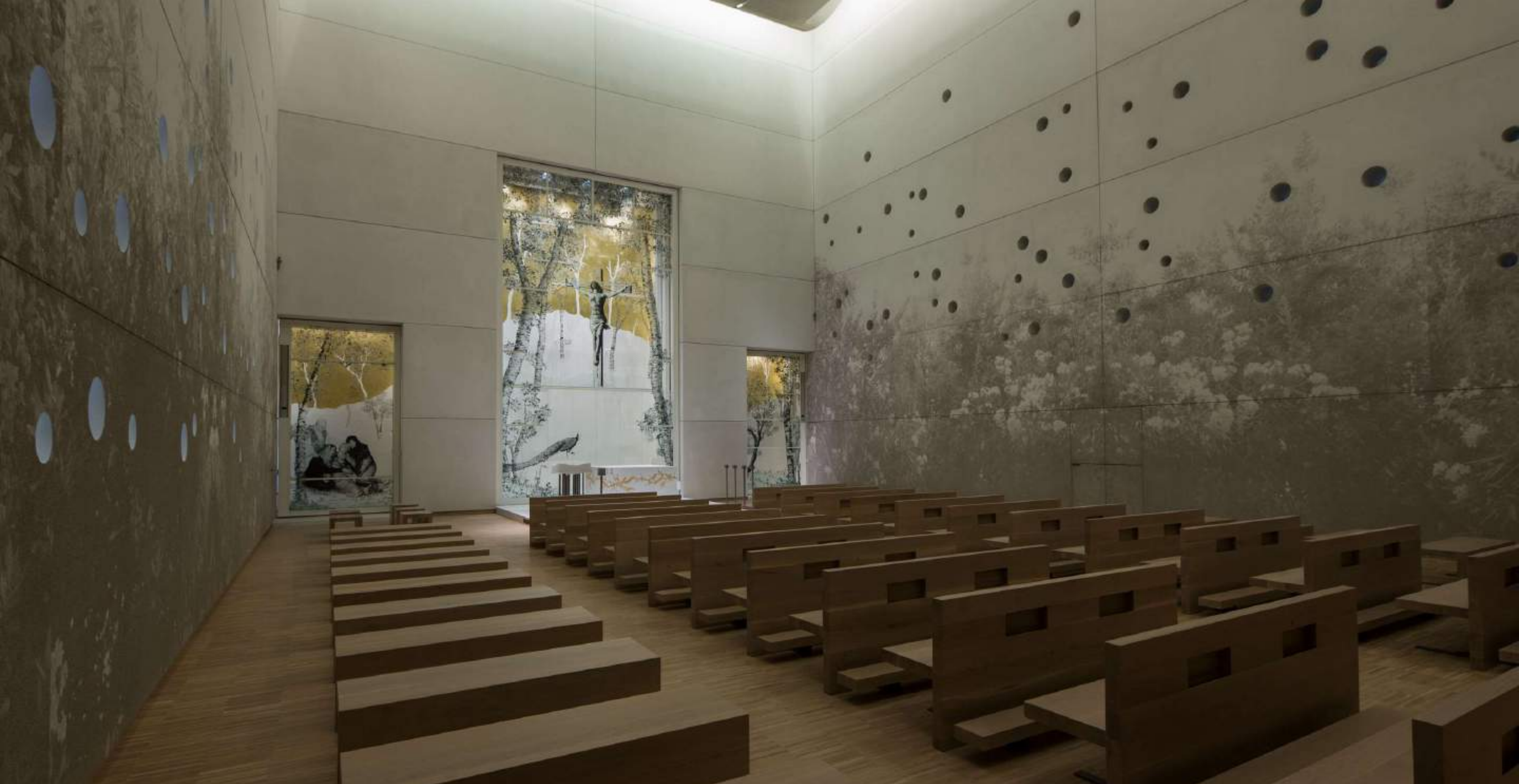
Chiesa Ospedale Papa Giovanni XXIII (BERGAMO)