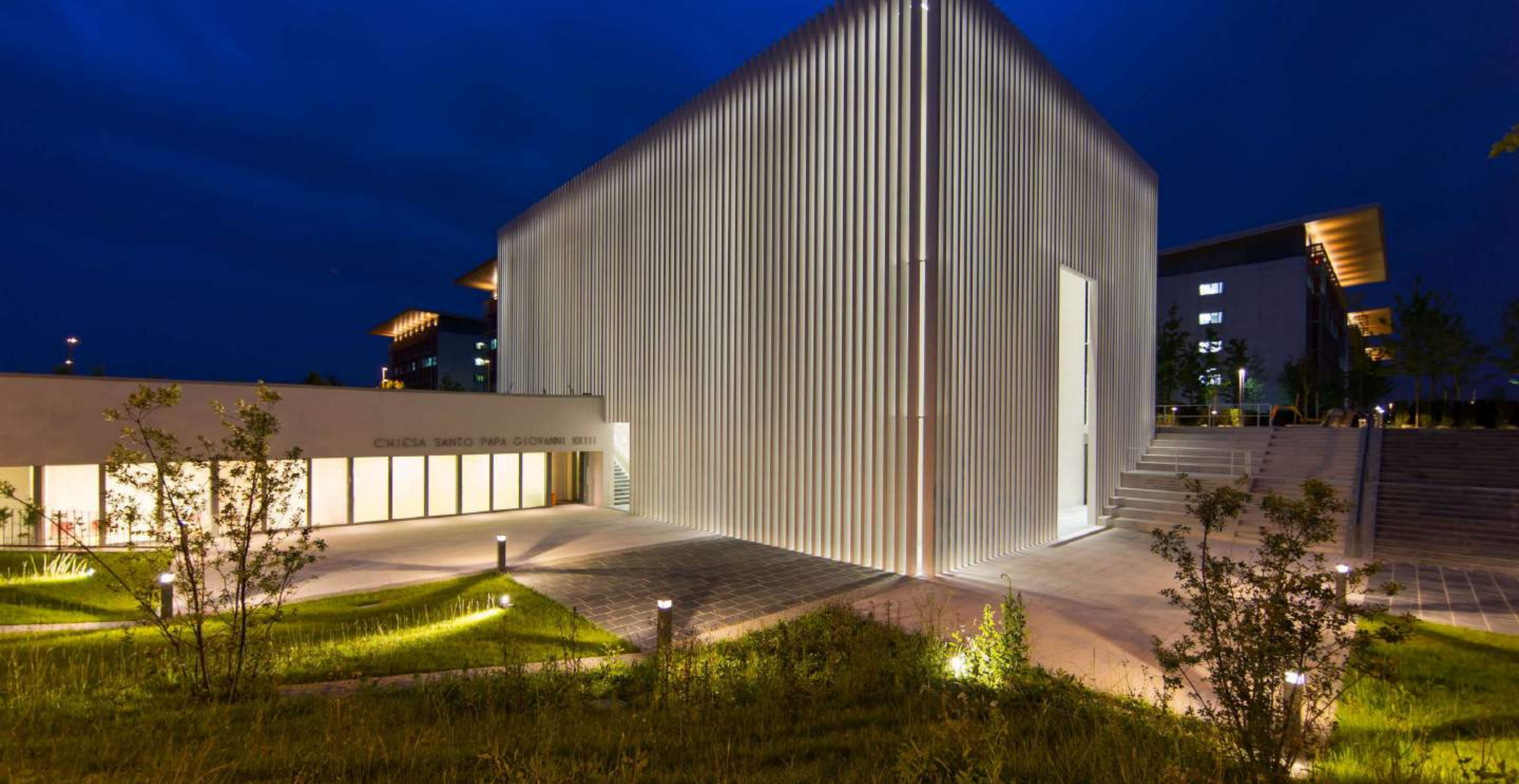
Chiesa Ospedale Papa Giovanni XXIII (BERGAMO)