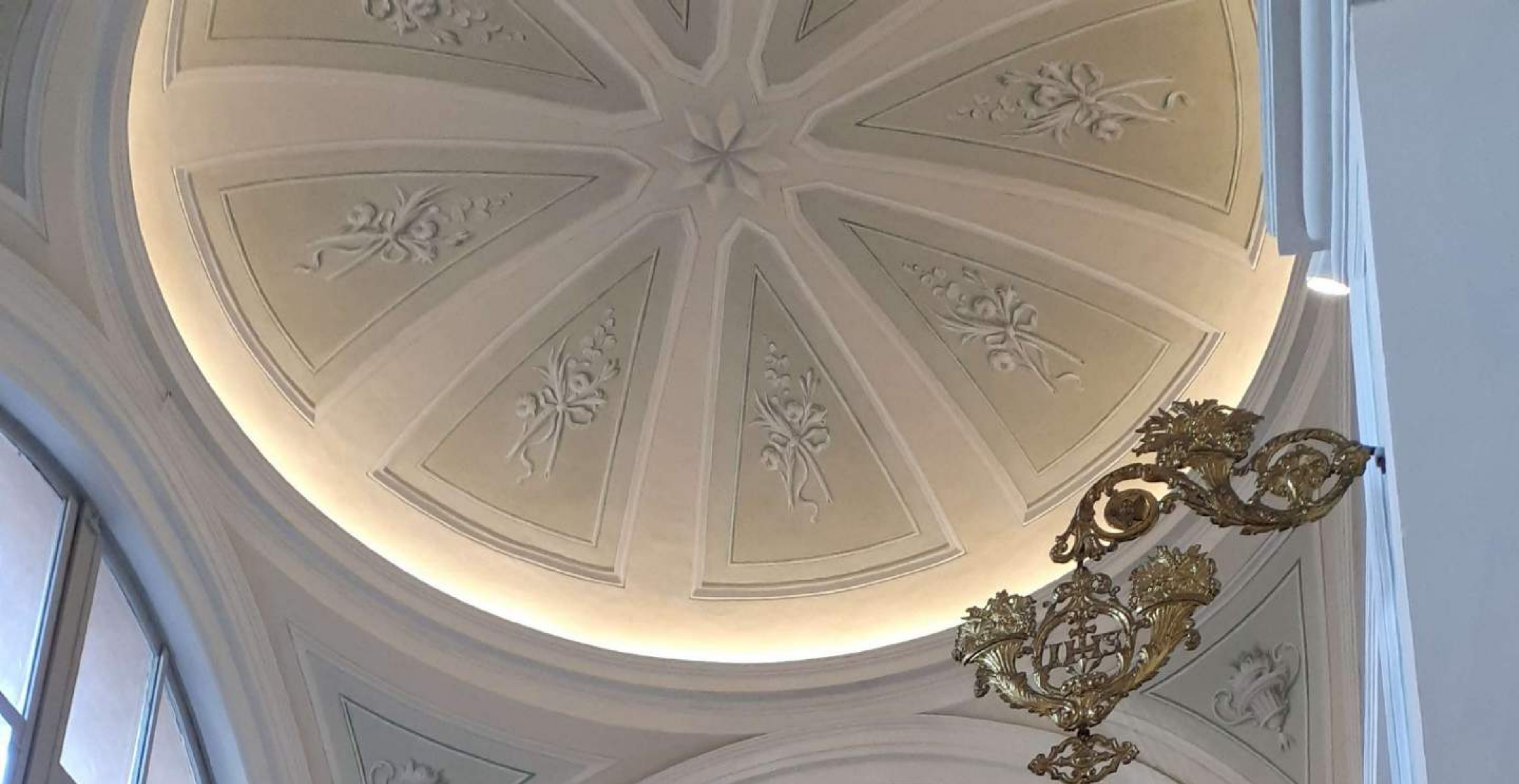
Cappella dell'Assunta (LECCO)