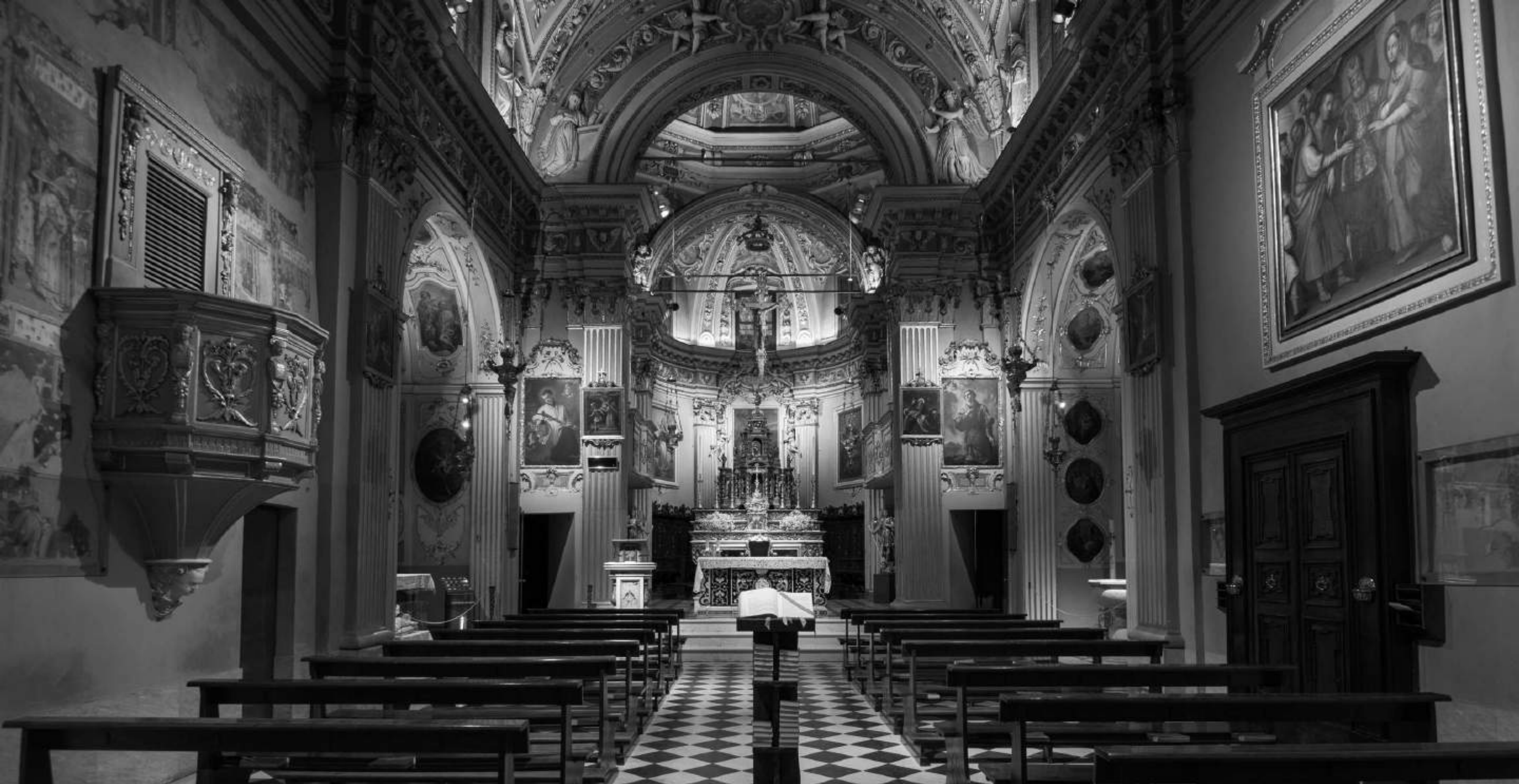
Chiesa Sforzatica Santa Maria, Dalmine (BERGAMO)