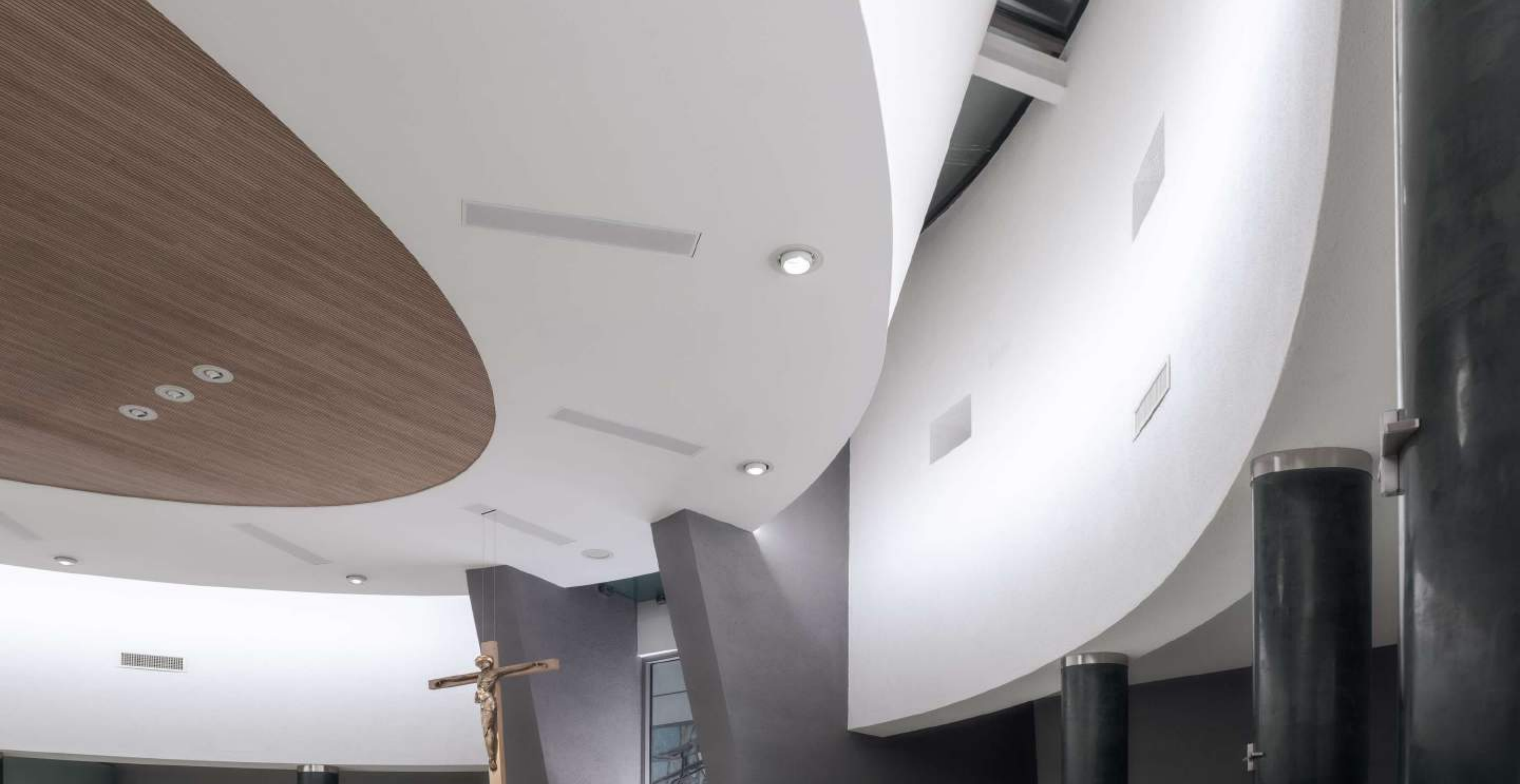
Chiesa parrocchiale di Andrate (COMO)