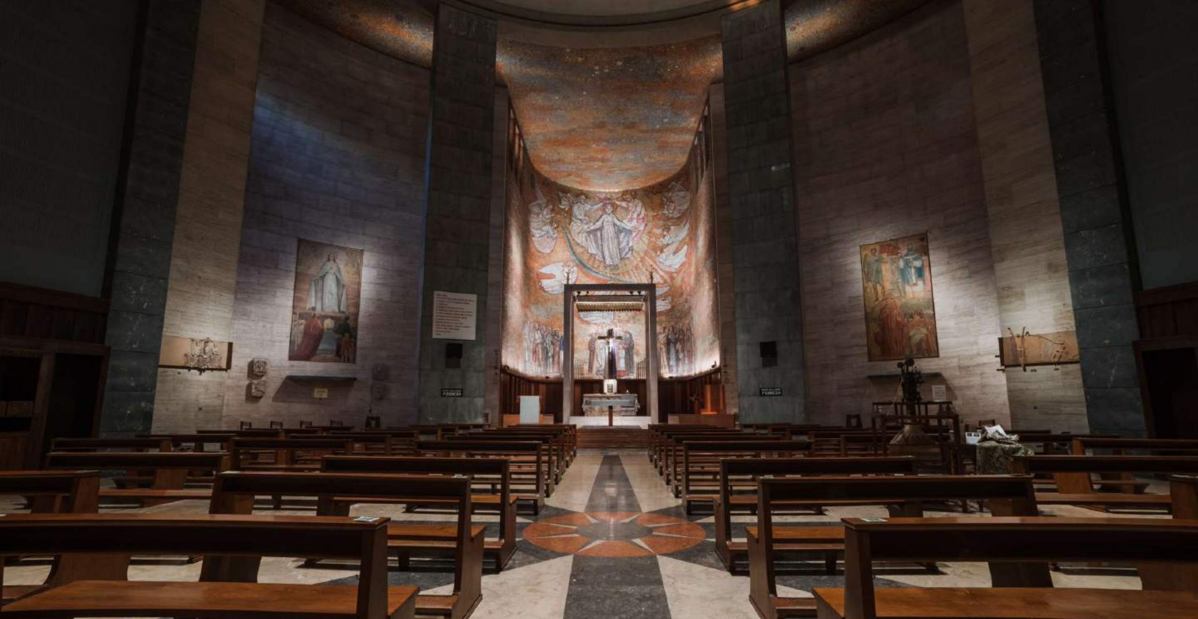
Tempio votivo (BERGAMO)