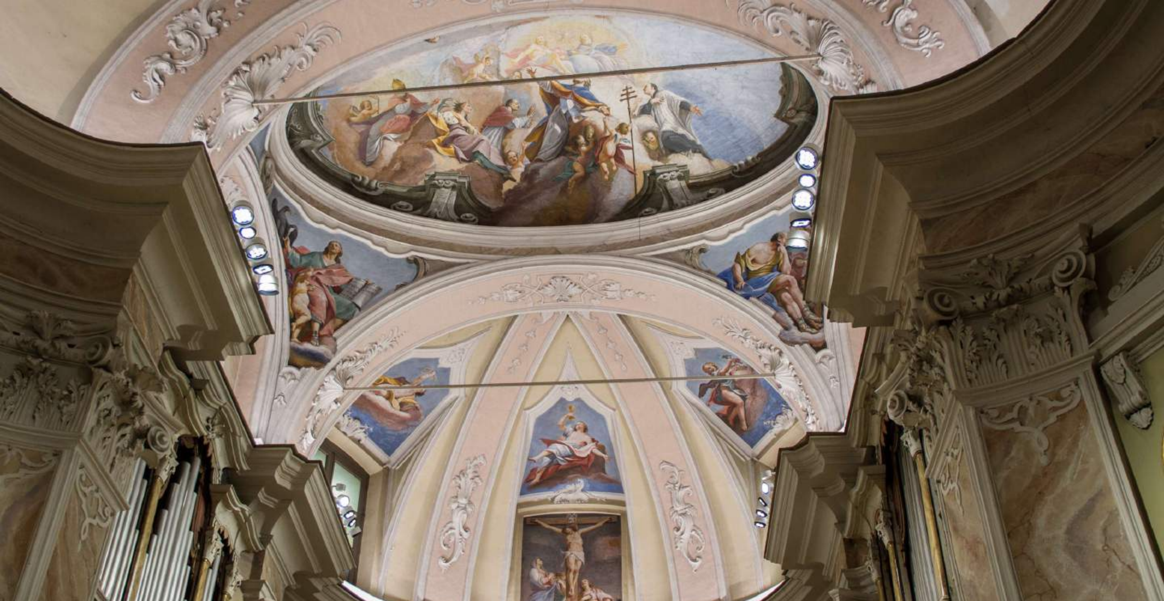
Chiesa parrocchiale di Cenate (BERGAMO)